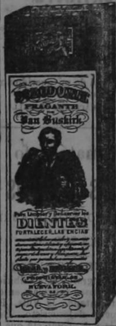
Esta es la figura exacta del paquete según su peso.

HALL & RUCKEL, 215 Washington St., New York, N. Y. U. S. A.